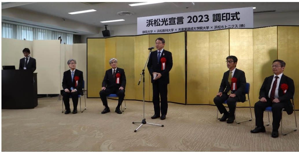
中野浜松市長挨拶