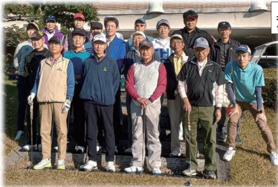
参加賞 オリジナルデザイン グリーンフォーク